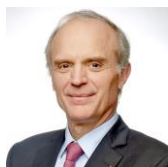
Florent MENEGAUX Presidente del Grupo Michelin

“Al igual que la seguridad, la ética es asunto de todos. La implementación y respeto de este Código depende del compromiso de cada empleado, sin importar su puesto o función. Nuestra conducta individual y colectiva debe ajustarse a los valores del Grupo. Todos somos garantes de los valores, reputación, imagen y legado que el Grupo Michelin construye y fortalece a lo largo del tiempo, para asegurar la protección de sus empleados y su sostenibilidad.”