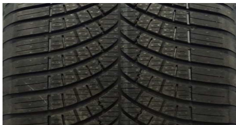
GOODYEAR VECTOR 4 SEASONS GEN-3 205/55 R16 94V M+S