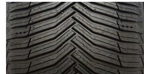
MICHELIN CROSSCLIMATE 2 205/55 R16 94V M+S