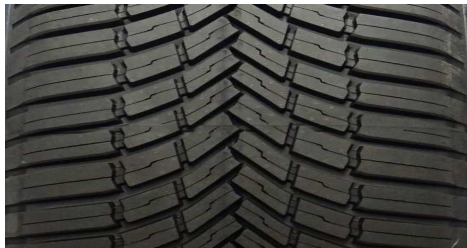
BRIDGESTONE WEATHER CONTROL A005 EVO 205/55 R16 94V M+S

GEPRÜFTE REIFEN – 205/55 R16 - Auszug aus dem Report CPA MARK20E (19CPA11-349)