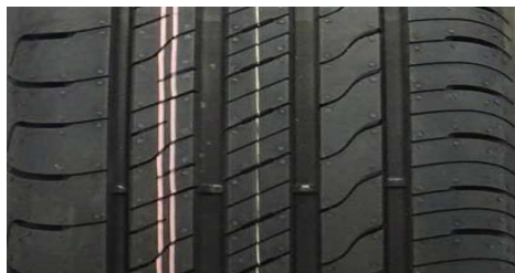
GOODYEAR EFFICIENTGRIP PERFORMANCE 2 205/55 R16 91V