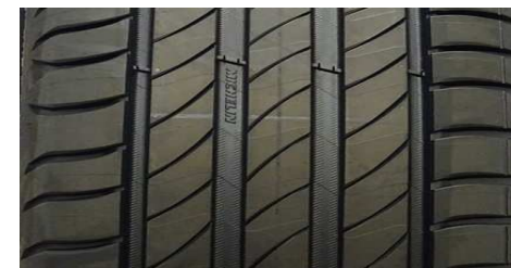
MICHELIN PRIMACY 4+ 205/55 R16 91V