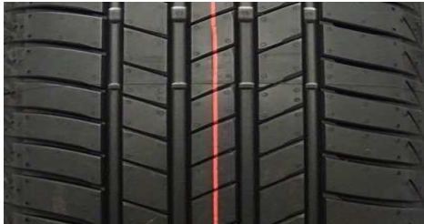
BRIDGESTONE TURANZA T05 205/55 R16 91V

GEPRÜFTE REIFEN – 205/55 R16 - Auszug aus dem Report CPA MARK21C (20CPA11-277)