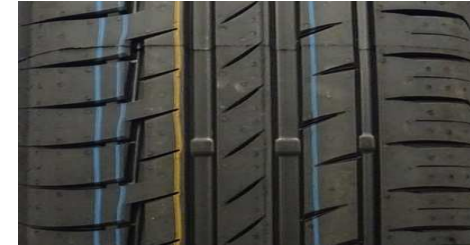
CONTINENTAL PREMIUMCONTACT 6 205/55 R16 91V