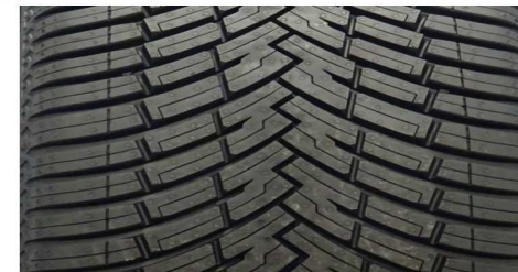
PIRELLI CINTURATO ALL SEASON SF2 205/55 R16 94V XL M+S