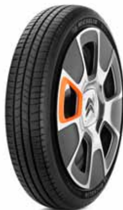
Citroën C4 Cactus by MICHELIN

En effet, sous une apparente simplicité, le pneu cache une nature complexe, combinaison de nombreux matériaux aptes à assurer diverses fonctions et son architecture sophistiquée résulte d'un procédé de fabrication spécifique. Mais ce n'est pas tout. Les travaux complexes menés sur le design jouent un rôle tout aussi important car ils signent la marque, signifient l'usage du pneu et son appartenance à une gamme, expriment les performances et révèlent les technologies contenues dans le pneu tout en créant l'attractivité. La complexité du travail sur le design d'un pneu réside dans le fait que la moindre modification du design de la bande de roulement par exemple peut influencer la performance du pneu. Aussi, les designers doivent travailler main dans la main avec les concepteurs techniques des pneumatiques pour trouver les solutions innovantes permettant l'expression de ce design tout en optimisant les performances du pneu.