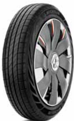
Renault Eolab by MICHELIN

A l'occasion du salon international de l'automobile de Francfort 2015, Michelin présente sur les différents pneus exposés, et au travers d'un « Concept Tires Book », les réalisations de son studio de Design des 12 dernières années pour les pneus des concepts-car des constructeurs automobiles mondiaux.