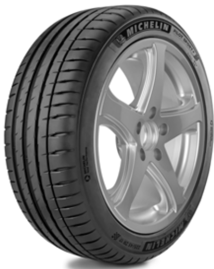
MICHELIN Pilot Sport 4

... Montre, sur les pneus présentés sur le stand et au travers de son « Concept Tire book » les travaux du Studio de Design Michelin , qui fusionnent technologies et design, au service de la performance et du style. La technologie Premium Touch en est une illustration.