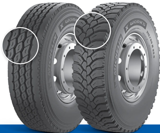
MICHELIN X® WORKS™ XDY