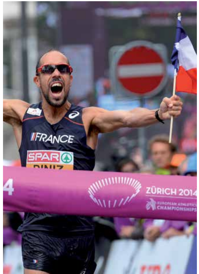
Yohann Diniz, partenaire de Michelin.

Terrain de l’innovation poussée à son paroxysme, la compétition est une composante de l’histoire de Michelin et de son développement dans toutes les entités du Groupe, y compris MICHELIN Lifestyle. A ce titre, le partenariat de compétences signé en février 2013 entre Michelin et Yohann Diniz, champion du monde des 50 kilomètres marche, est faite d’évidence et de pertinence. L’objet de cette collaboration consiste à accroître les connaissances des performances des chaussures de sport pour en concevoir de nouvelles.