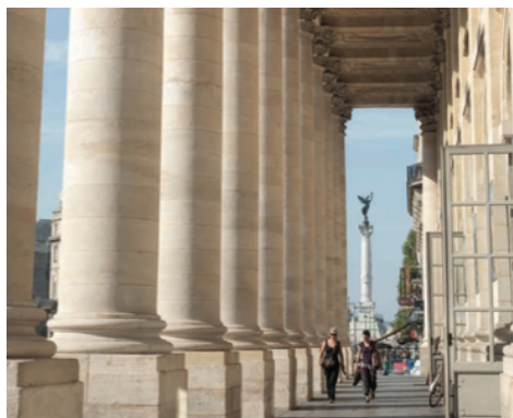
Le Vieux Bordeaux (Gironde – 33) ★★★

Les étoiles du Guide Vert Michelin constituent l'ADN de chacun des guides. Elles permettent aux visiteurs d'identifier en un coup d'œil les plus beaux sites et monuments des régions. L'évaluation du niveau d'intérêt de chaque site repose sur 9 grands critères établis et évalués en toute indépendance par les équipes éditoriales de Michelin qui se sont rendues sur place.