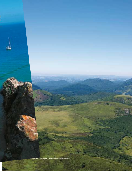
Le port d'Estaque, Clémentine, Estafeta.com