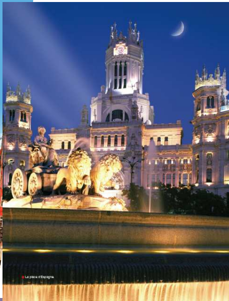
La place d'Espagne