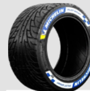
WET DRYING WET ET FULL WET

Medium : pour piste abrasive et/ou températures supérieures à 30°C