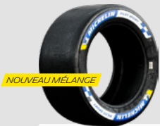
SLICKS SOFT COLD, SOFT HOT, MEDIUM

Une nouvelle gamme de pneus MICHELIN Pilot Sport Hypercar.