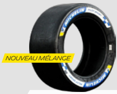
SLICKS SOFT COLD, SOFT HOT, MEDIUM

Une nouvelle gamme de pneus MICHELIN Pilot Sport Hypercar.