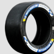
SLICK SOFT HOT, MEDIUM

MICHELIN a été choisi par l'ensemble des concurrents de la catégorie LM GTE AM