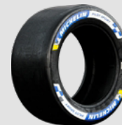
SLICK SOFT COLD, SOFT HOT, MEDIUM

MICHELIN a été choisi par l'ensemble des concurrents de la catégorie LM GTE AM