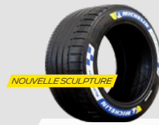
WET FULL WET

Medium : piste abrasive, tracé sollicitant, températures supérieures à 30°C