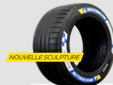
WET FULL WET

Medium : piste abrasive, tracé sollicitant, températures supérieures à 30°C