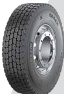
X@ COACH™ XD