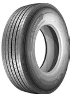
X@ COACH™ ENERGY Z