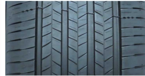
MICHELIN PRIMACY 5 ENERGY 215/55 R18 99V XL