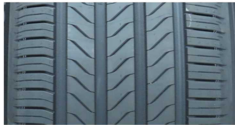
MICHELIN PRIMACY 5 215/55 R18 99V XL

GEPRÜFTE REIFEN – 215/55 R18 - Auszug aus dem Report CPA MARK25E (24CPA11-351)