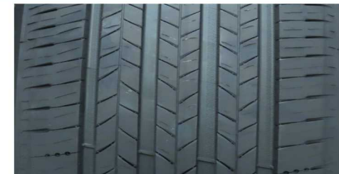
MICHELIN PRIMACY 5 ENERGY 205/55 R16 91V