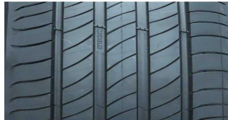
MICHELIN E-PRIMACY 205/55 R16 91V

GEPRÜFTE REIFEN – 205/55 R16 - Auszug aus dem Report CPA MARK25D (24CPA11-351)