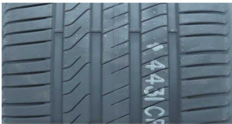
PIRELLI CINTURATO C3 215/55 R18 99V XL