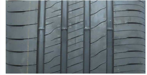
GOODYEAR EFFICIENTGRIP PERFORM. 2 215/55 R18 99V XL