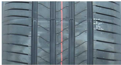
BRIDGESTONE TURANZA 6 ENLITEN 215/55 R18 99V XL

Massenverlust während des Tests Summe der 4 Positionen