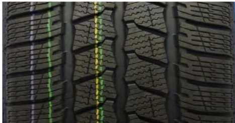
CONTINENTAL VANCONTACT WINTER 235/65 R16C 115/113R M+S

GEPRÜFTE REIFEN - 235/65 R16C - Auszug aus dem Report CPA MARK17F (16CPA11-411-1)