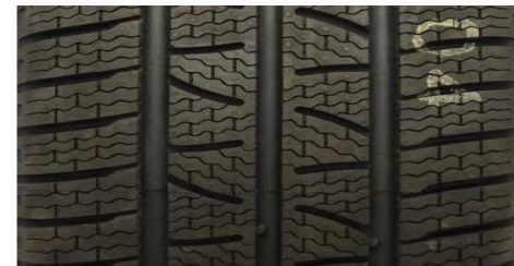
PIRELLI CARRIER WINTER 235/65 R16C 115/113R M+S