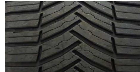
MICHELIN AGILIS CROSSCLIMATE 235/65 R16C 115/113R M+S