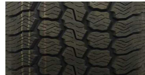
GOODYEAR CARGO VECTOR 235/65 R16C 115/113R M+S