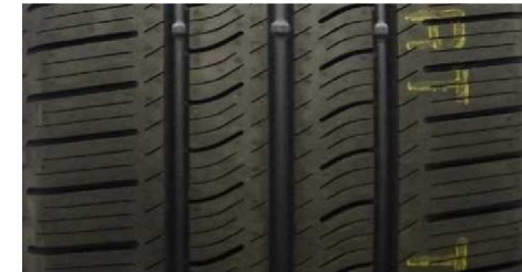
PIRELLI CARRIER ALL SEASON 235/65 R16C 115/113R M+S