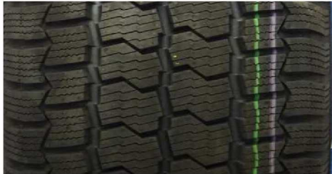
CONTINENTAL VANCOFOURSEASON 2 235/65 R16C 115/113R M+S

GEPRÜFTE REIFEN - 235/65 R16C - Auszug aus dem Report CPA MARK17F (16CPA11-411-1)