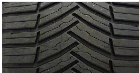
MICHELIN AGILIS CROSSCLIMATE 235/65 R16C 115/113R M+S