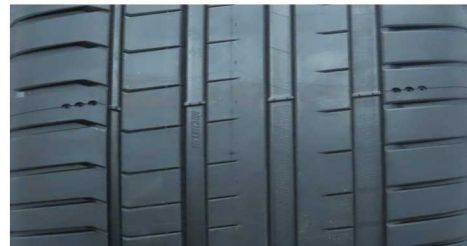
MICHELIN PILOT SPORT 5 255/40 ZR20 101Y XL

GEPRÜFTE REIFEN – 255/40 R20 - Auszug aus dem Report CPA MARK25H (24CPA11-351)