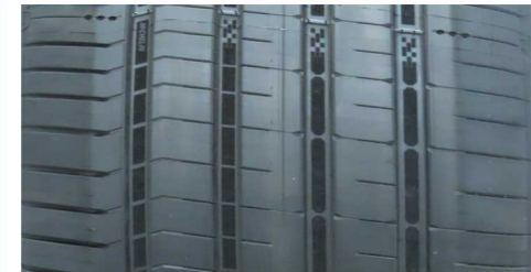
MICHELIN PILOT SPORT 5 ENERGY 255/40 R20 101Y XL