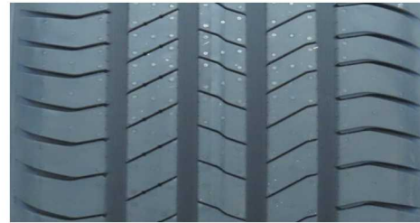
HANKOOK ION GT SUV 215/55 R18 99V XL