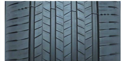
MICHELIN PRIMACY 5 ENERGY 215/55 R18 99V XL