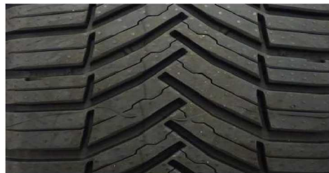
MICHELIN AGILIS CROSSCLIMATE 235/65 R16C 115/113R M+S