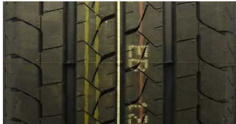
BRIDGESTONE DURAVIS R660 235/65 R16C 115/113R M+S

GEPRÜFTE REIFEN - 235/65 R16C - Auszug aus dem Report CPA MARK17F (16CPA11-411-1)