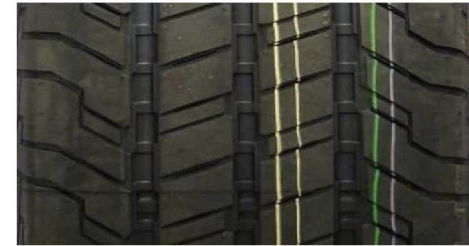
CONTINENTAL CONTIVANCONTACT 100 235/65 R16C 115/113R